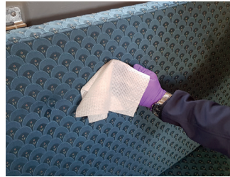
3. Desinfiser tekstiler som f.eks. dyner, setetrekk, sikkerhetsbelter.