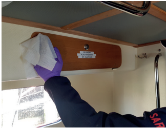
1. Desinfiser treflater.