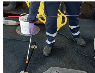
3. Desinfisering av båt / bil dekk