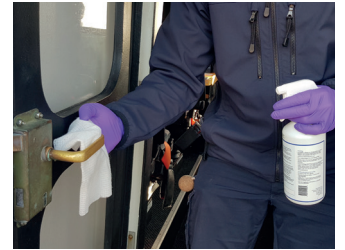
4. Desinfiser alle håndtak, gelender osv.