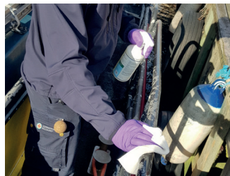
2. Desinfiser rekka og ledere.