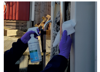
4. Desinfiser håndtak