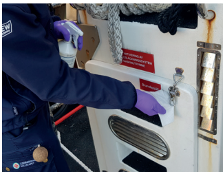
1. Desinfiser alle kontaktpunkt som håndtak, rekkverk etc.